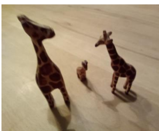
MAKRO-Methoden: Öffnende Lern- und Unterrichtsformen