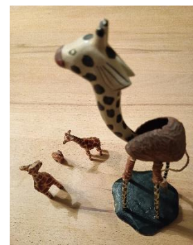
META-Methode: 5-Phasen-Le h r n arrangement