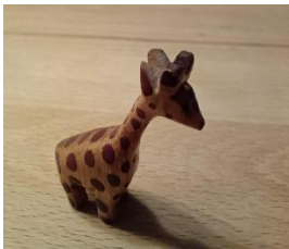
MIKRO-Methoden: Einsatz in definierten Phasen

Das 5-Phasen- Le h r n arrangement stellt die Universalmethode für alles Lernen und Lehren dar und wird somit als META-Methode bezeichnet.